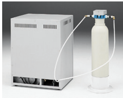
连接组件G (WL100+WG251型连接例)