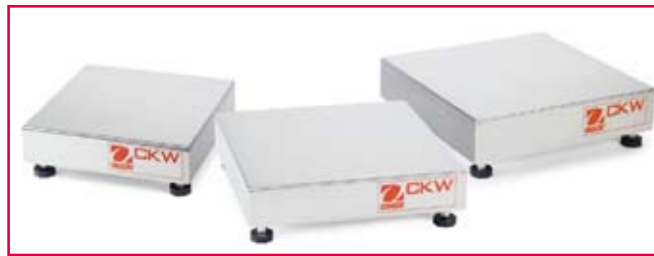
4种容量、三种台面尺寸可供选择