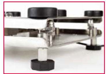
裸露处无沟槽的圆滑设计，能有效的减少残渣堆积，符合食品安全标准