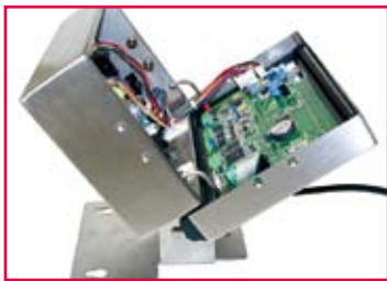
铰接式前盖安装，维修方便