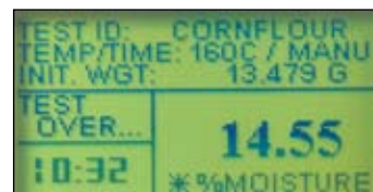
超大液晶显示屏，提供丰富测定信息