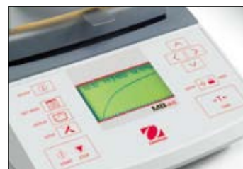
智能化软件，可显示测定过程曲线